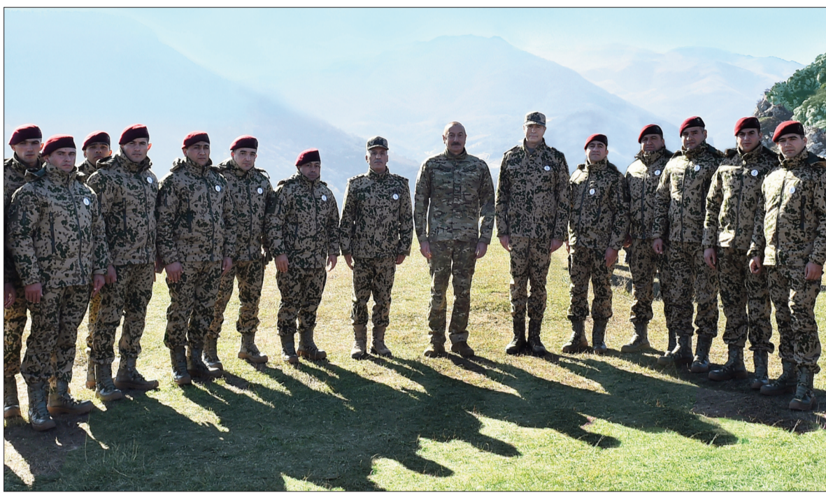
gərlərdə göstərdikləri şücaət və fədakarlıq nümunələri xalqımızın yad-

Azərbaycan Respublikasının Prezidenti, Silahlı Qüvvələrin Müzəffər Ali Baş Komandanı cənab İlham Əliyevin rəhbərliyi altında Da-