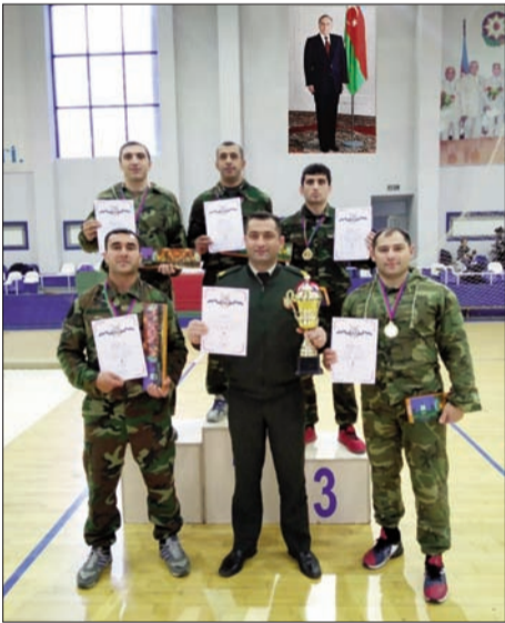
Daxili Qoşunların yığma komandası birincilər sırasında

Dekabr ayının 12-dən 14-dək Daxili İşlər Nazirliyinin birinciliyi uğrunda silahsız özünümüdafiə üzrə yarış keçirilib. Bütün təşkilatı məsələlərin uğurla həyata keçirildiyi yarışda iştirakı təmin olunan Daxili Qoşunların yığma komandasının üzvləri xidmət etdikləri qurumu yüksək səviyyədə təmsil ediblər. Belə ki, müvafiq çəki dərəcə-