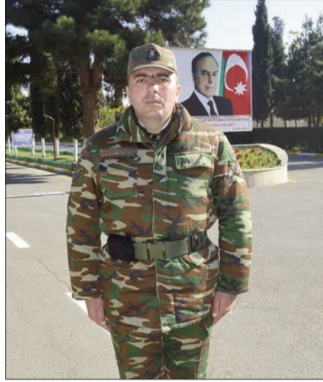
aradan qaldırılmasını diqqətdə saxlayır.

O, hər zaman tabeliyində olan hərbi qulluqçulara qayğı göstərir, onların ehtiyaclarını öyrənir və aşkar olunmuş nöqsanların