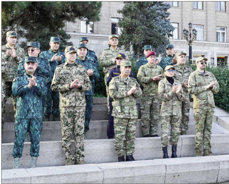
Xankəndidə keçirilən hərbi paradda Azərbaycan Silahlı Qüvvələrinin bir hissəsi iştirak edir.

herinin mərkəzi meydanında hərbi paradı keçirməyimiz bir daha onu göstərir ki, nə qədər düzgün, müdrik addım idi.