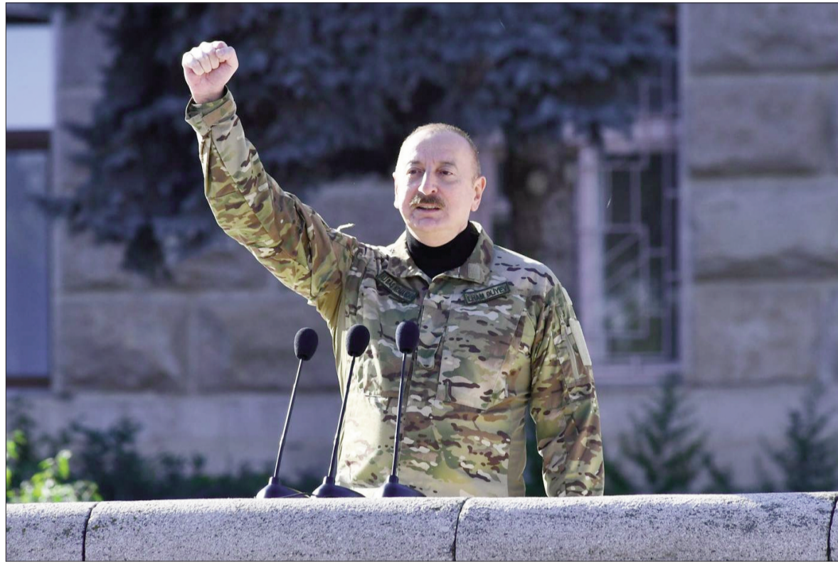
İlham Əliyev birinci xanım Mehriban Əliyevə və oğulları Heydər Əliyevlə birlikdə Xankəndidə keçirilən hərbi paradda çıxış edir.

lər keçdikcə bu ümidlər tükenirdi. Ermənistan öz xoşu ilə bizim torpaqlarımızdan çıxmaq istəmirdi. Ermənistan-Azərbaycan münacişesinin nizamlanması ilə məşğul olmuş vasitəçilər faktiki olaraq vəziyyəti dondurmağa çalışırdılar, hesab edirdilər ki, Azərbaycan xalqı bu vəziyyətlə barışacaq. Ancaq Azərbaycan xalqı heç vaxt bu vəziyyətlə barışmaq fikrində deyildi və mən dəfələrlə bunu müxtəlif kürsülərdən bəyan etmişdim ki, biz bu vəziyyətlə barışmayacağıq. Azərbaycan torpağında ikinci erməni dövlətinin yaradılmasına icazə verməyəcəyik, danışıqlar nəticəsiz başa çatsa, güc təltib edərək beynəlxalq hüquq əsasında öz doğma torpaqlarımızı döyüş meydanında işğalçılardan azad edəcəyik. Əgər Ermənistan rəhbərliyi və onun arxasında o vaxt və bu gün duran bəzi xarici qüvvələr mənim sözlərimə qulaq assaydılar, İkinci Qarabağ müharibəsinə ehtiyac qalmazdı. Mən dəfələrlə deyirdim, Ermənistan rəhbərliyinə müraciət edərək deyirdim ki, əgər siz bizim torpaqlarımızdan çıxmasanız, döyüş meydanında bizimlə üz-üzə gələcəksiniz və sizin arxanızda kim istəyirsə dursun, bu, bizi haqq yolu-