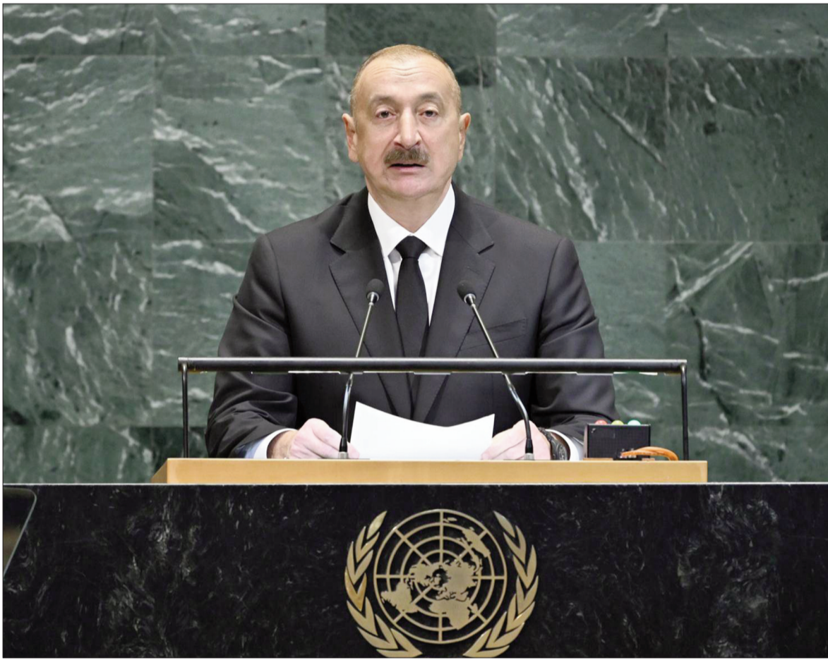
Donald TRAMP: “Mən Sizinlə, həqiqətən, fəxr edirəm. Siz çox gözəl insansınız”

“Birlikdə daha yaxşı: 80 il və daha çox sülh, inkişaf və insan hüquqları naminə” mövzusunda həsr olunmuş sessiyada qlobal gündəlikdə duran məsələlərə aid, o cümlədən dünyanın bəzi yerlərində davam edən münaqişələr, Dayanıqlı İnkişaf Məqsədləri, iqlim böhranı və digər mövzularda müzakirələr aparılır. Sözügedən sessiyada iştirak etmək üçün ABŞ-yə işgüzar səfərə gedən Prezident İlham Əliyev BMT-nin bu mötəbər tədbiri çərçivəsində mehç qarşı tərəflərin istəyi ilə xeyli sayda ölkə liderləri, nəhəng şirkətlərin rəhbərləri ilə görüşüb. Bu, Azərbaycana beynəlxalq səviyyədə marağın, onun başçısına şəxsi ehtiram və hörmətin göstəricisidir.