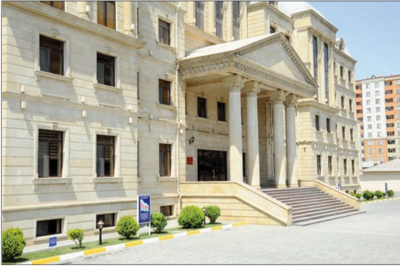
Gənc çağırışçıların qəbulu Daxili Qoşunlar Komandanlığının nəzarəti altında həyata keçirilir

Məlum olduğu kimi, Azərbaycan Respublikasının Prezidenti, Silahlı Qüvvələrin Ali Baş Komandanı cənab İlham Əliyevin müvafiq sərəncamına uyğun olaraq, iyul ayının 1-dən etibarən Daxili İşlər Nazirliyinin Daxili Qoşunlarında gənc çağırışçıların müddətli həqiqi hərbi xidmətə qəbulu prosesi həyata keçirilir. Sərəncamdan irəli gələn tələblərin yerinə yetirilməsi məqsədilə, Daxili İşlər Nazirliyinin müavini-Daxili Qoşunların Komandanının "Daxili Qoşunlara çağırışçıların seçilməsi, qəbulu, daşınması və sıraya daxil edilməsi ilə əlaqədar təşkilati təd-