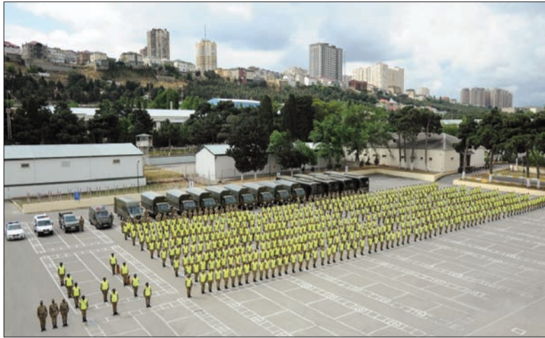
"Formula-1 Azərbaycan Qran Pri" yarışları ilə əlaqədar Daxili Qoşunların şəxsi heyətinin hazırlığı yoxlanılıb

İdmanın müxtəlif növləri üzrə dünya və qitəmiqyaslı çempionatların, beynəlxalq turnirlərin məhz paytaxt Bakı şəhərində keçirilməsi xüsusilə qürurvericidir.