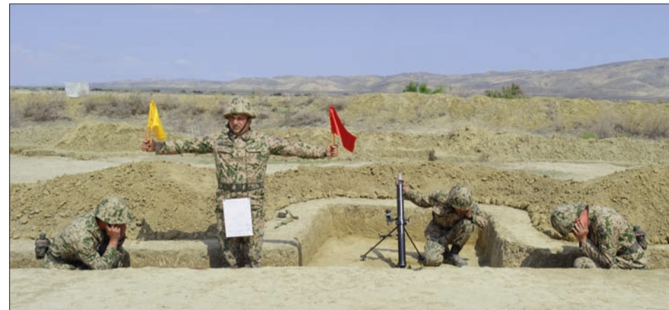
yeti ilə ərazinin vizual kəşfi, qiymətləndirilməsi, döyüş əmrinin hazırlanması, ərazinin xəritəsindən istifadə edərək hədəfləri müəyyən etməklə atışların keçirilməsi, artilleriya

atışı və onun idarə olunması üzrə məşğələlər təşkil olunub.