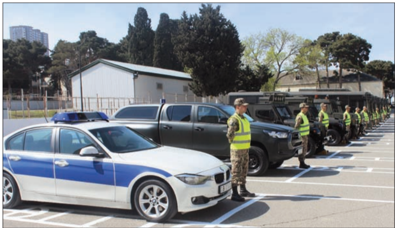
Aprel 20-də Daxili İşlər Nazirliyinin Daxili Qoşunlarının Bakı şəhərində yerləşən “N” saylı hərbi hissələrində Daxili Qoşunların ko-

mandanlığı tərəfindən “Formula-1 Azərbaycan Qran Pri” yarışları zamanı polis orqanlarının əməkdaşları ilə birlikdə ictimai qaydanın qorunmasına və ictimai təhlükəsizliyin təmin olunmasına cəlb ediləcək hərbi qulluqçuların xidmətə hazırlığı, təminat-təchizat məsələlərinin həlli, eləcə də nəqliyyat vasitələrinin vəziyyəti yoxlanılıb.