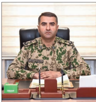
mənin vəziyyətinin yaxşılaşdırılması sahəsində kəsərli tədbirlər