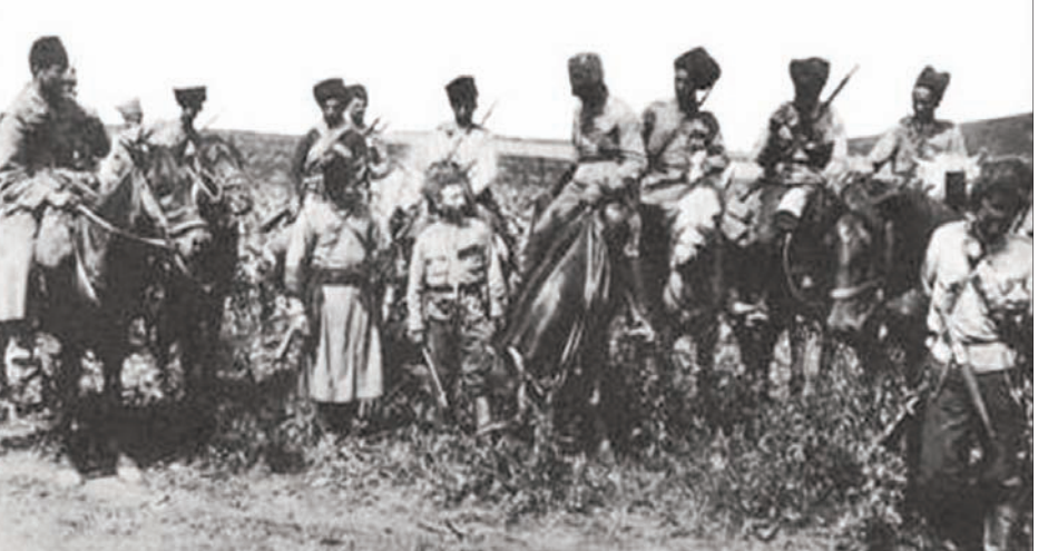
Naxçıvan generalları. XIX əsr.